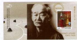
2. Σετ 2 Φακέλων Πρώτης Ημέρας Κυκλοφορίας/ Set of 2 First Day Covers Τιμή / Price: 7,00 €