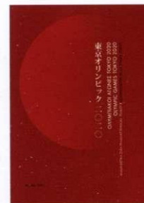
3. Αριθμημένο Λεύκωμα Σειράς/ Numbered Set Album Τιμή/Price: 18,00 €