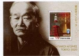
1. Σετ 2 Φεγιέ / Set of 2 feuillets Τιμή/Price: 4,80 €