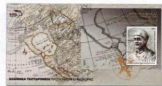
2. Φάκελος Πρώτης Ημέρας Κυκλοφορίας First Day Cover Τιμή / Price: 3,80 €