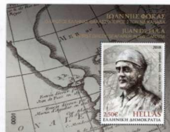
1. Φεγιά / Feuillet Τιμή / Price: 2,50 €