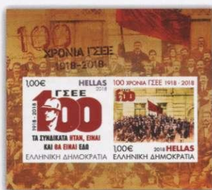
1. Φεγιά / Feuillet Τιμή / Price: 2,00 €