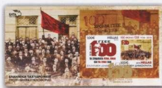
2. Φάκελος Πρώτης Ημέρας Κυκλοφορίας First Day Cover Τιμή / Price: 4,50 €