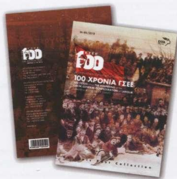
3. Απλό Άλμπουμ Γραμματοσήμων Regular Set Album Τιμή / Price: 9,00 €