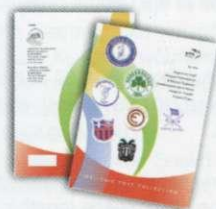
3. Απλό Άλμπουμ Γραμματοσήμων Regular set Album Τιμή / Price: 21 €