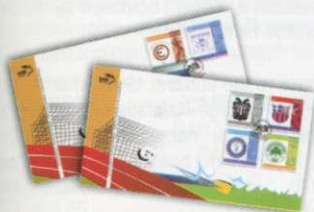
1. Φάκελος Πρώτης Ημέρας Κυκλοφορίας First Day Cover Τιμή / Price: 9,40 €