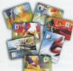
4. Κάρτες Μάξιμουμ / Maximum Cards Τιμή / Price: 10,50 €