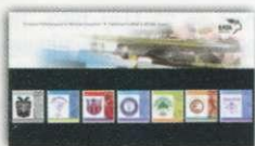
2. Τυποποιημένη Σειρά / Set Pack Τιμή / Price: 9,29 €