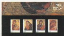
2. Τυποποιημένη Σειρά / Set Pack Τιμή / Price: 5,70 €