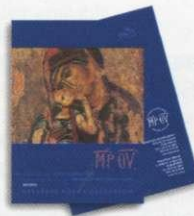
3. Απλό Άλμπουμ Γραμματοσήμων Regular set Album Τιμή / Price: 12,90 €