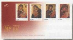
1. Φάκελος Πρώτης Ημέρας Κυκλοφορίας First Day Cover Τιμή / Price: 5,40 €