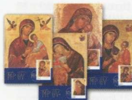
4. Κάρτες Μάξιμουμ / Maximum Cards Τιμή / Price: 6,10 €