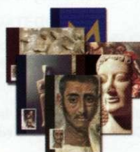
5. Κάρτες Μάξιμουμ / Maximum Cards Τιμή / Price: 8,60 €