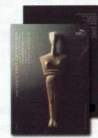
4. Απλό Άλμπουμ Γραμματοσήμων Regular set Album Τιμή / Price: 15,60 €

Die Briefmarkensammler haben die Möglichkeit, ihre philatelistischen Sammelobjekte beim Zentralen Philatelistischen Dienst mit dem Sonderersttagsstempel abstempeln zu lassen unter der Voraussetzung, Marken der Serie im Wert von mindestens € 0,50 auf diese geklebt zu haben.