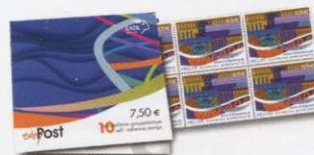
1. Γραμματόσημα / Stamps Τιμή / Price: 5,39 €