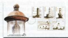
2. Φάκελος Πρώτης Ημέρας Κυκλοφορίας First Day Cover Τιμή / Price: 8,40 €