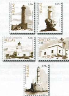
1. Γραμμάτσημα / Stamps Τιμή / Price: 6,48 €