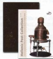
3. Απλό Άλμπουμ Γραμματοσήμων Regular set Album Τιμή / Price: 20,20 €