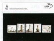
5. Τυποποιημένη Σειρά / Set Pack Τιμή / Price: 9,30 €