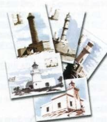
4. Κάρτες Μάξιμουμ / Maximum Cards Τιμή ανά τεμ. / Price per piece: 1,50 €