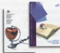
3. Απλό Άλμπουμ Γραμματοσήμων Regular set Album Τιμή / Price: 17,10 €