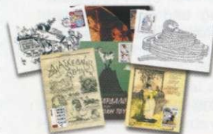
4. Κάρτες Μάξιμουμ / Maximum Cards Τιμή / Price: 9,00 €