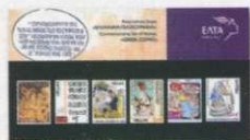
2. Τυποποιημένη Σειρά / Set Pack Τιμή / Price: 7,90 €