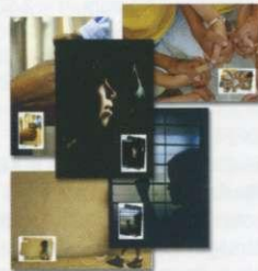
4. Κάρτες Μάξιμουμ / Maximum Cards Τιμή ανά τεμ. / Price per piece: 1,50 €