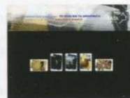
5. Τυποποιημένη Σειρά / Set Pack Τιμή / Price: 9,20 €