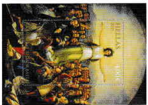
2. Αριθμημένο Φεγυέ / Numbered Feuille Τιμή / Price: 4,00 €