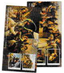
3. Σετ 2 Φακέλων Πρώτης Ημέρας Κυκλοφορίας / Set of 2 First Day Covers Τιμή / Price: 7,00 €