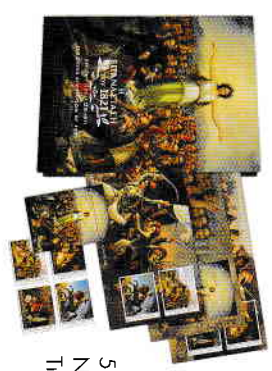
5. Αριθμημένο Λευκάκιμα Σειράς / Numbered Set Album Τιμή / Price: 26,00 €

ΕΠΙΧΕΙΡΗΣΗ ΤΟΥ 1821 ΕΘΝΙΚΗ ΠΙΝΑΚΟΘΗΚΗ ΑΘΗΝΑΙ 16.12.2021