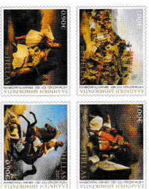
1. Γραμματόσημα / Stamps Τιμή / Price: 3,80 €